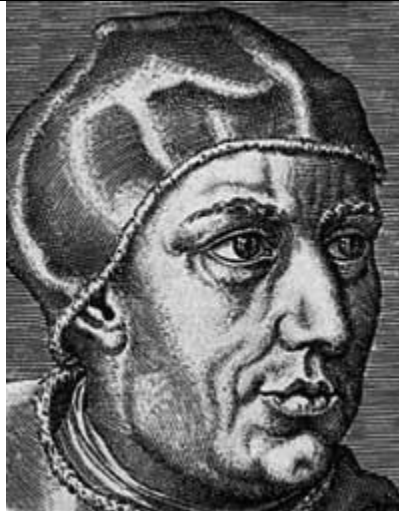
Michel Stifel (1486 – 1567)